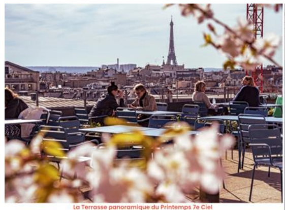
La Terrasse panoramique du Printemps 7e Ciel

Het prachtige warenhuis Le Printemps, een van de grootste warenhuizen van Parijs, heeft de bovenste (7 e ) verdieping omgevormd tot een vintage paradijs met Hermès-tassen uit de jaren tachtig tot recente stukken van Versace en Miu Miu. Maar het leuke is dat ze naast hun eigen fantastische bezit ook allerlei andere vintagewinkels een plek bieden om hun collectie te tonen. Een soort enorme vintagewinkel dus, bestaande uit allemaal kleine