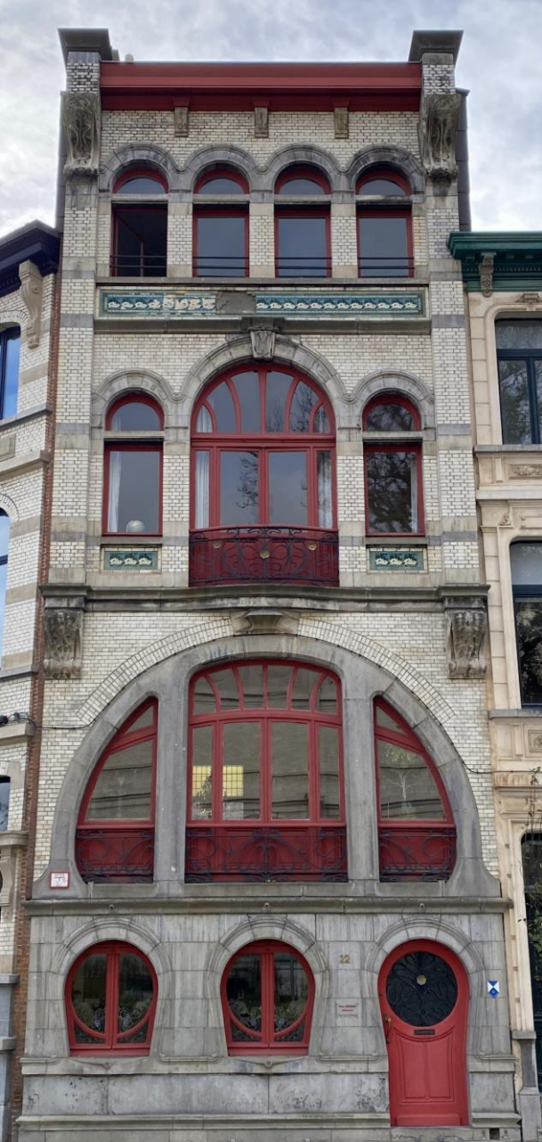
Het museum staat in een fraaie omgeving. Deze foto is voor de liefhebbers van Art Nouveau.