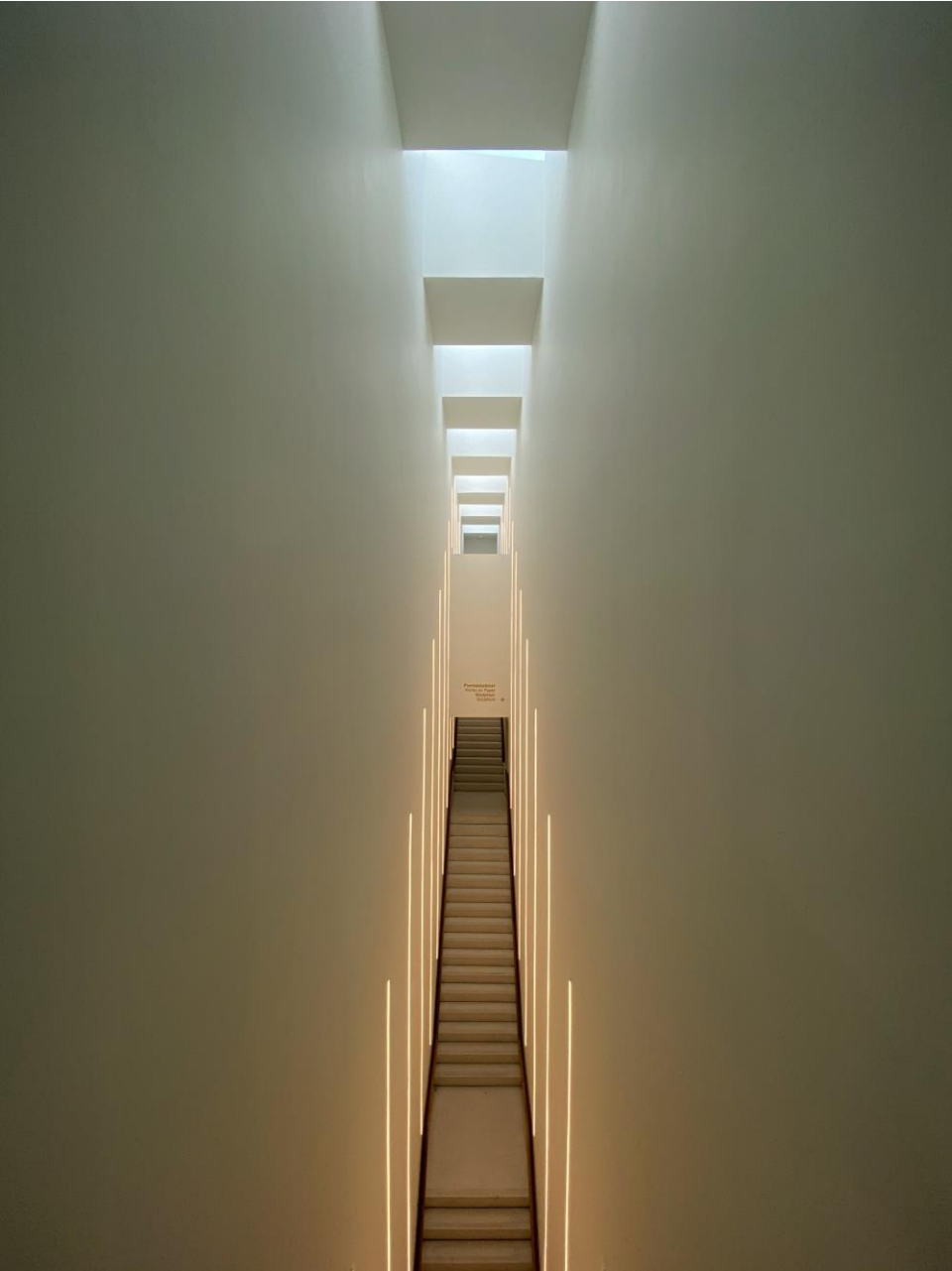
In het trappenhuis.