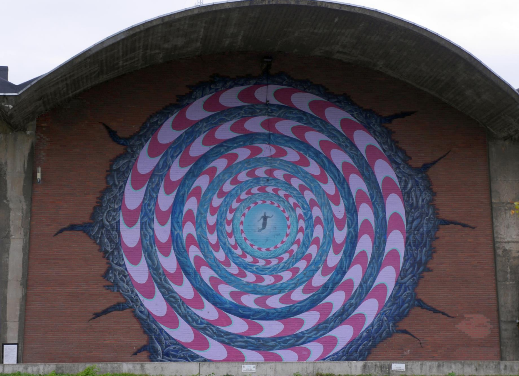
Geen graffiti... streetart.