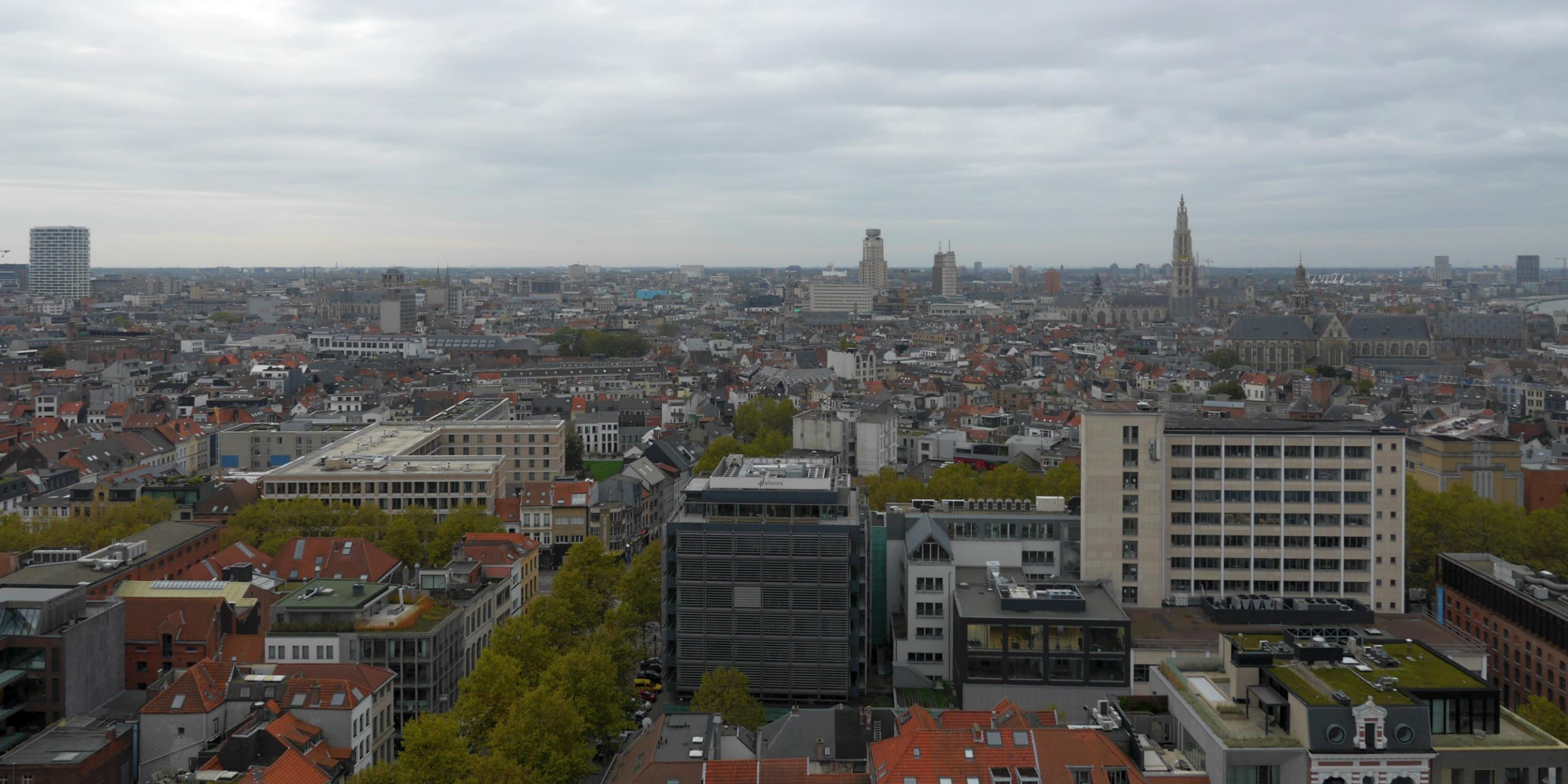
Blik vanaf het panoramadak van het MAS op het centrum van Antwerpen.