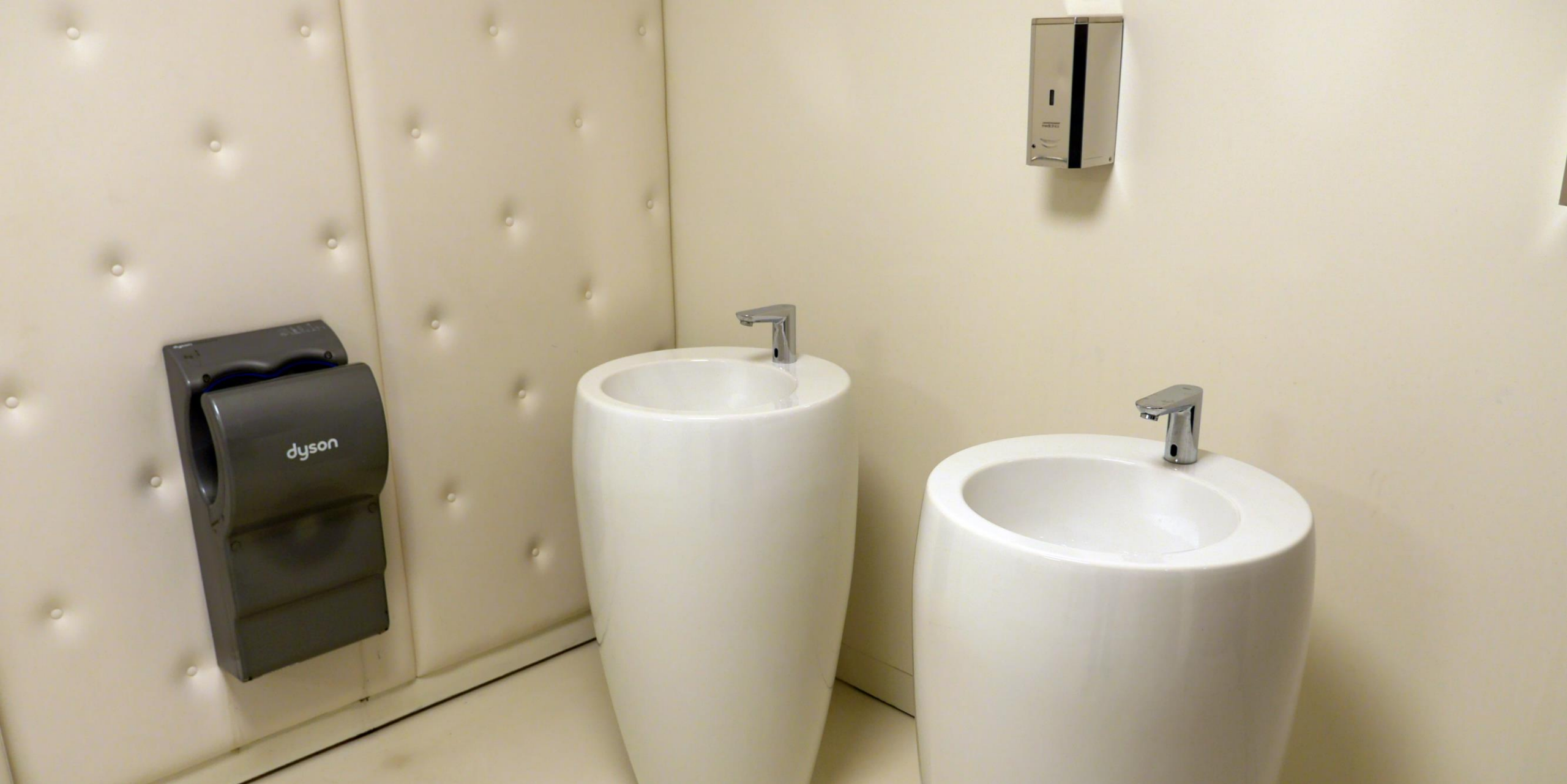
Een toilet in stijl. Ook hier was enige studie nodig om te bepalen wat nu het dames- en wat het herentoilet was... 😊