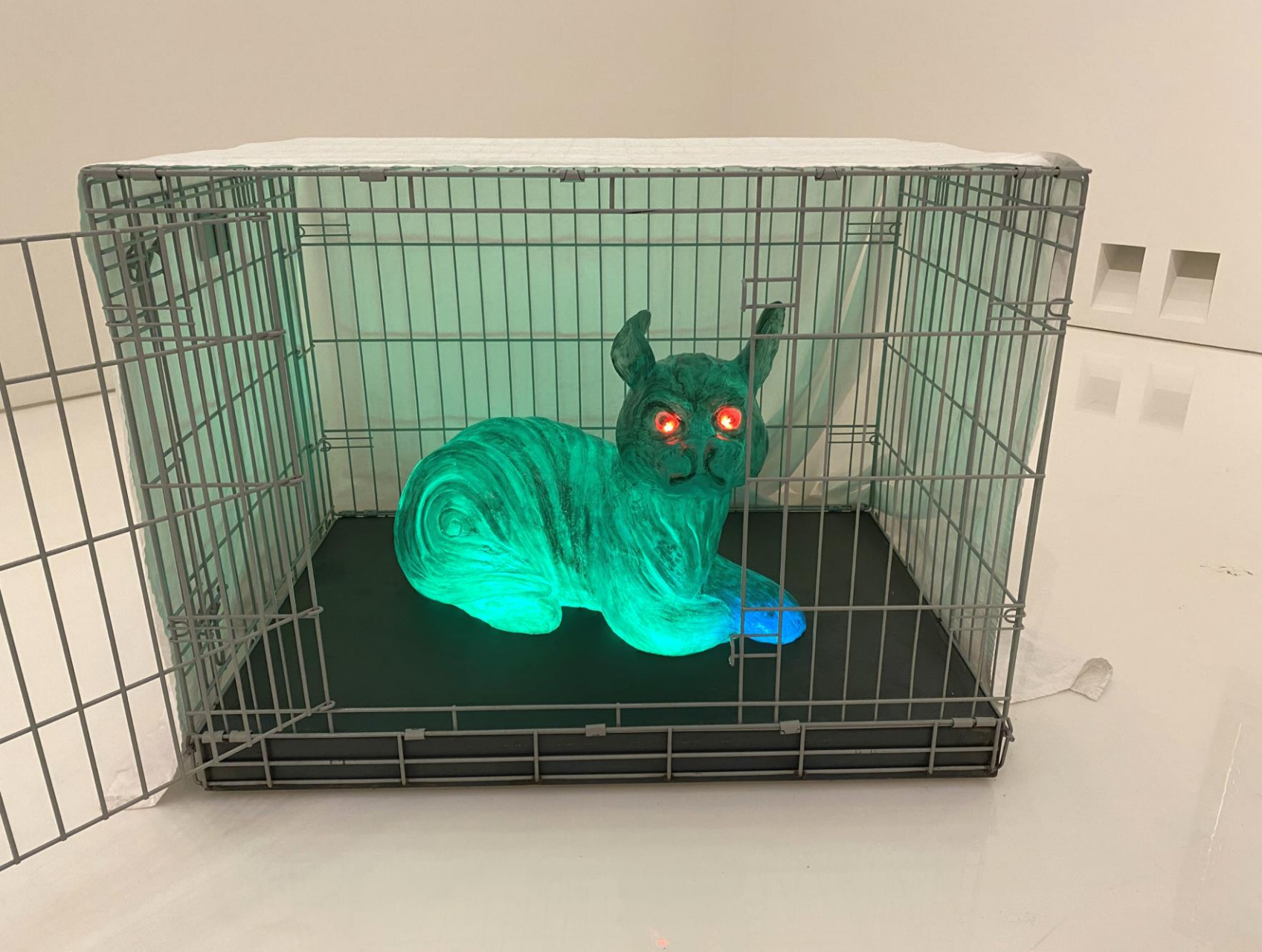
Zeer gevarieerde kunst.