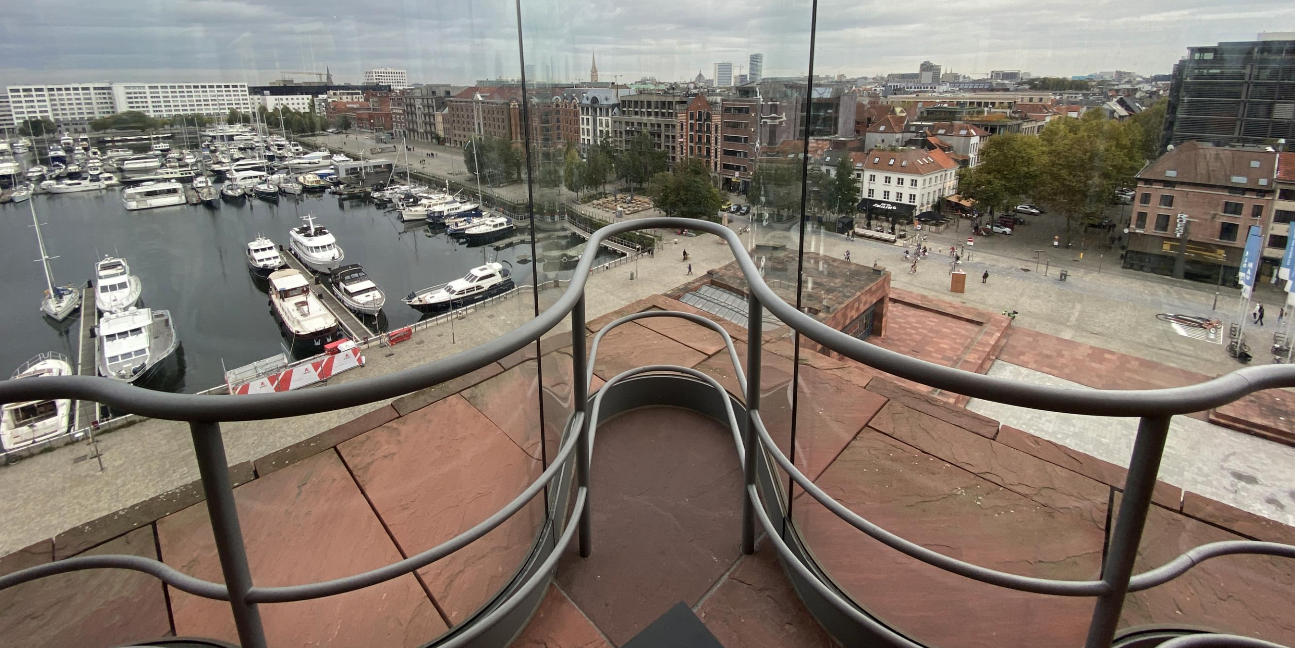
Het MAS ('Museum Aan de Stroom') is een prachtig gebouw. Met fraaie gebogen beglazing. En met een schitterend zicht op Antwerpen.