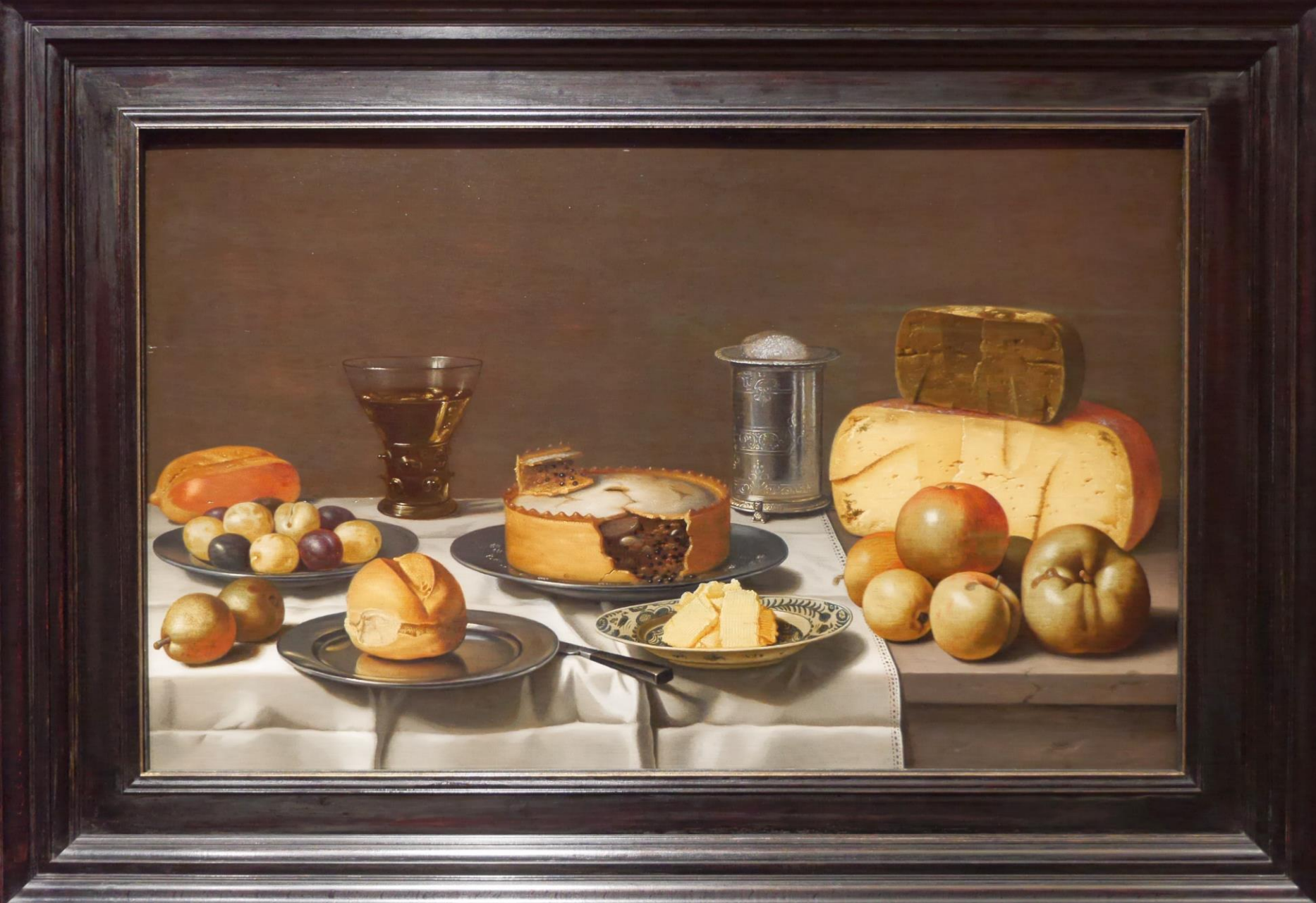
“Een Hollands ontbijt” van Floris van Schooten. Uit 1585.