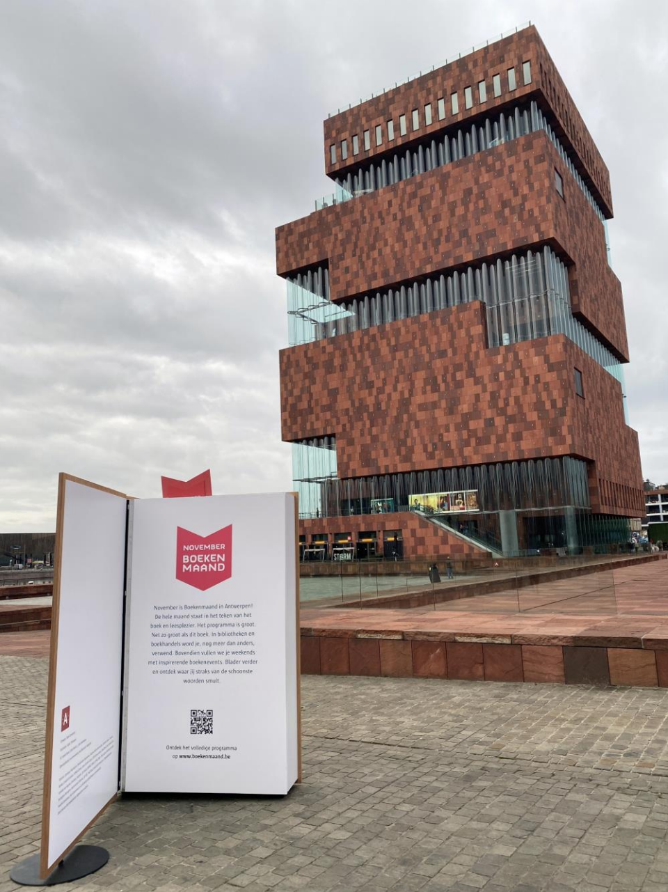
Niet alleen bij het MAS, maar overal is november boekenmaand.