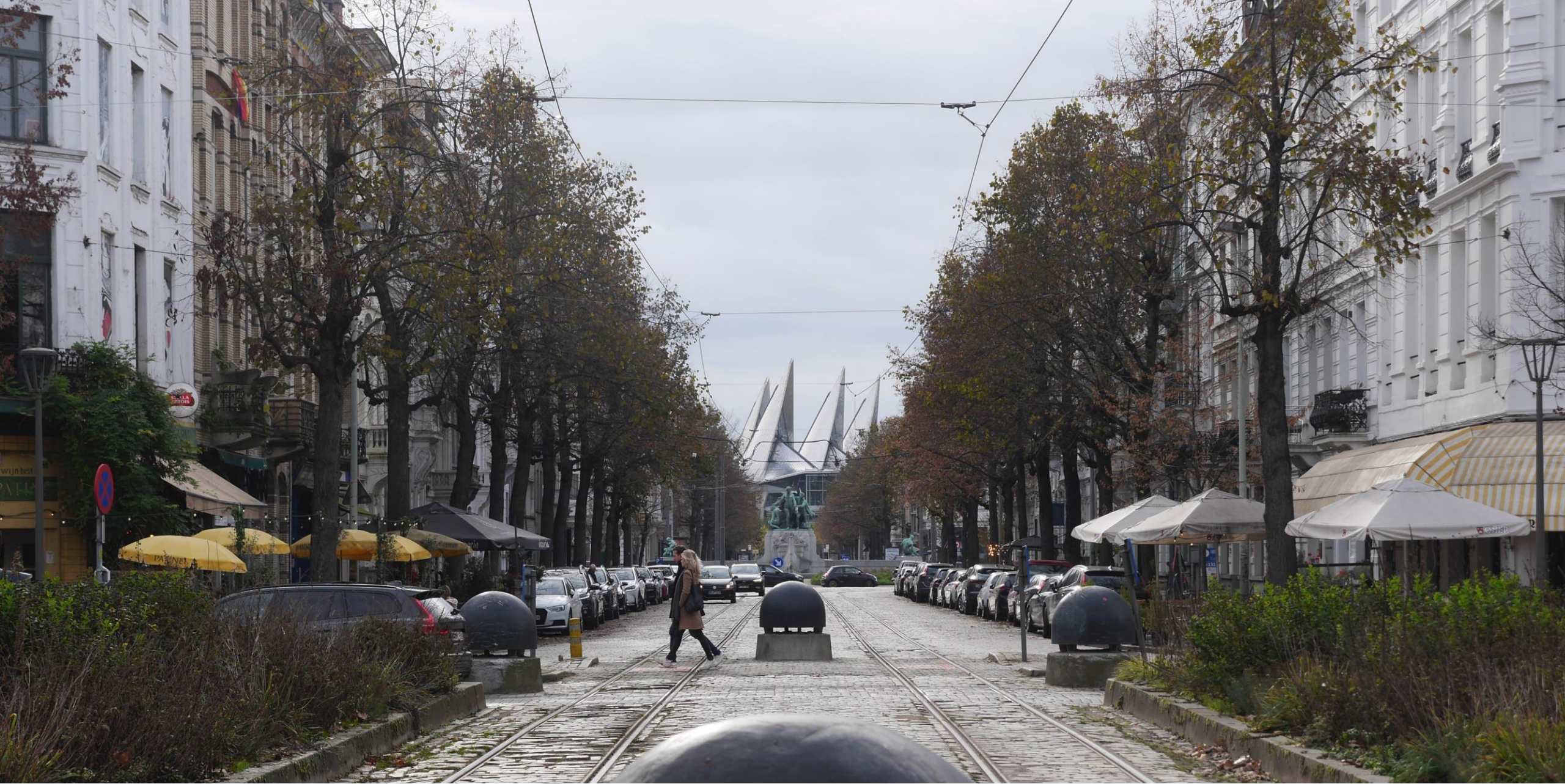
Op weg naar het gerechtsgebouw, zichtbaar in de verte.