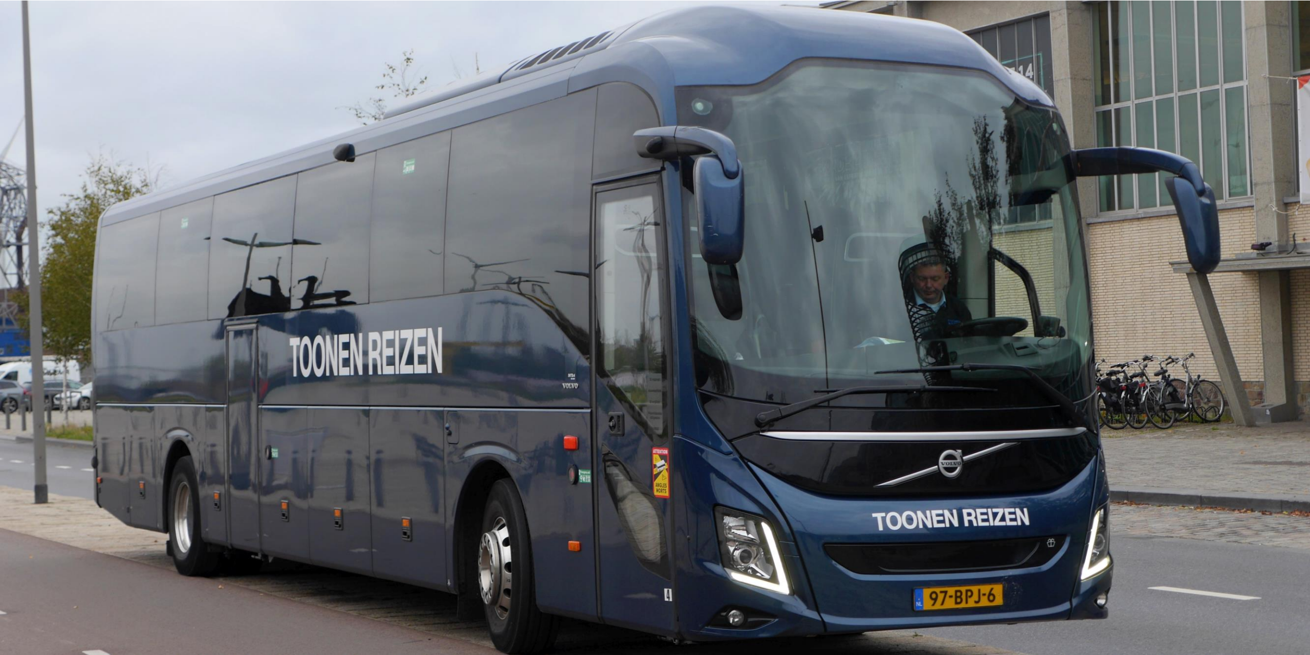
En met de bus van Toonen met chauffeur Gerard weer naar huis.