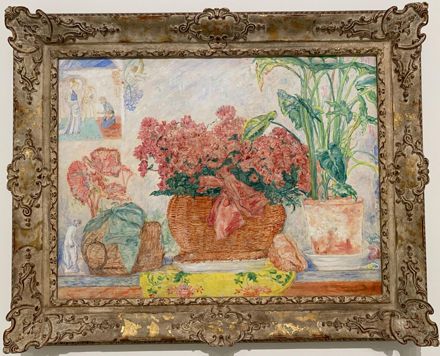
James Ensor – "Azalea's". 1920-1930.