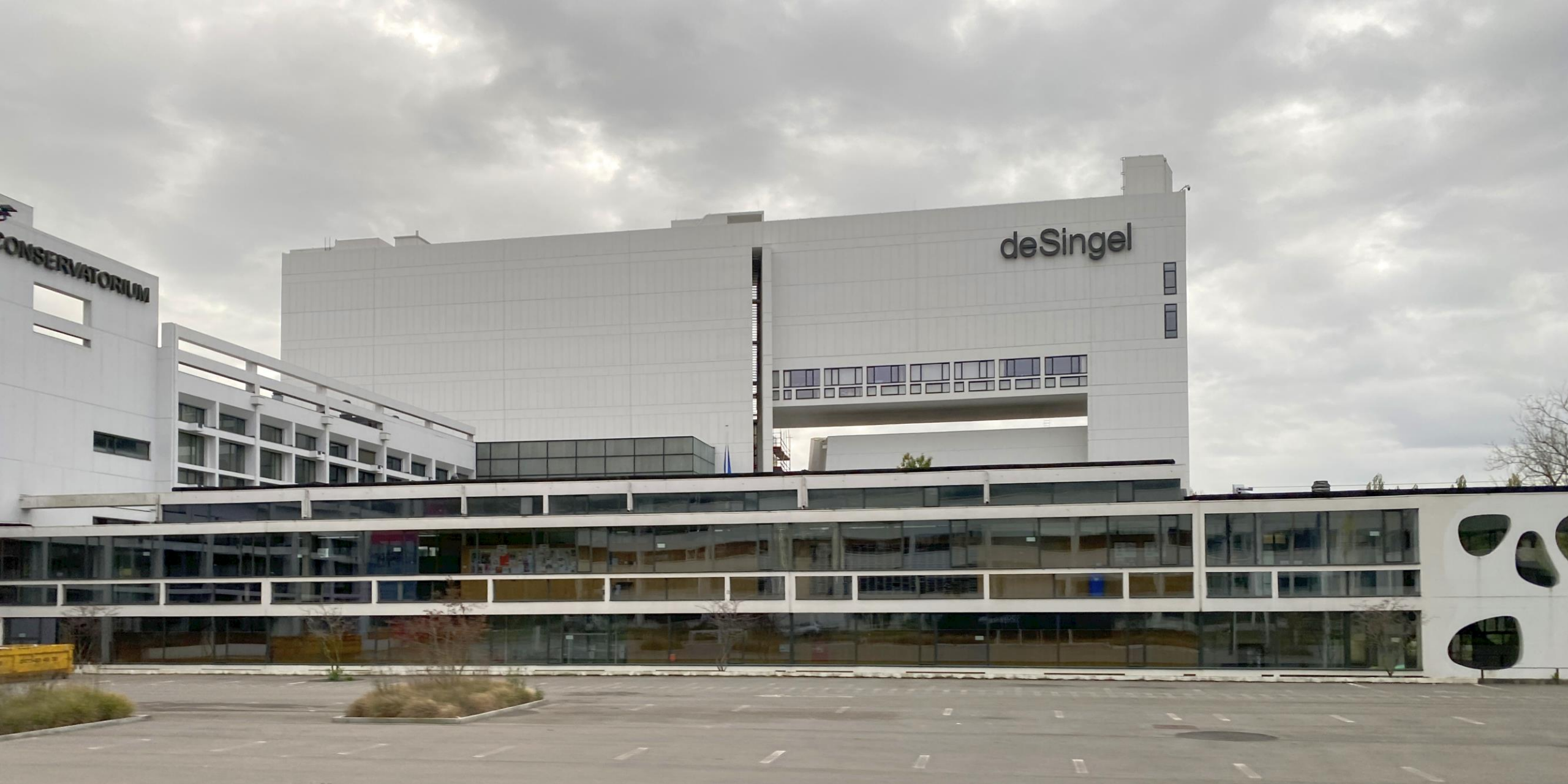
Wikipedia: 'de Singel is een kunstencentrum aan de Desguinlei in Antwerpen met een veelzijdig aanbod binnen de disciplines muziek, dans, theater en architectuur.'