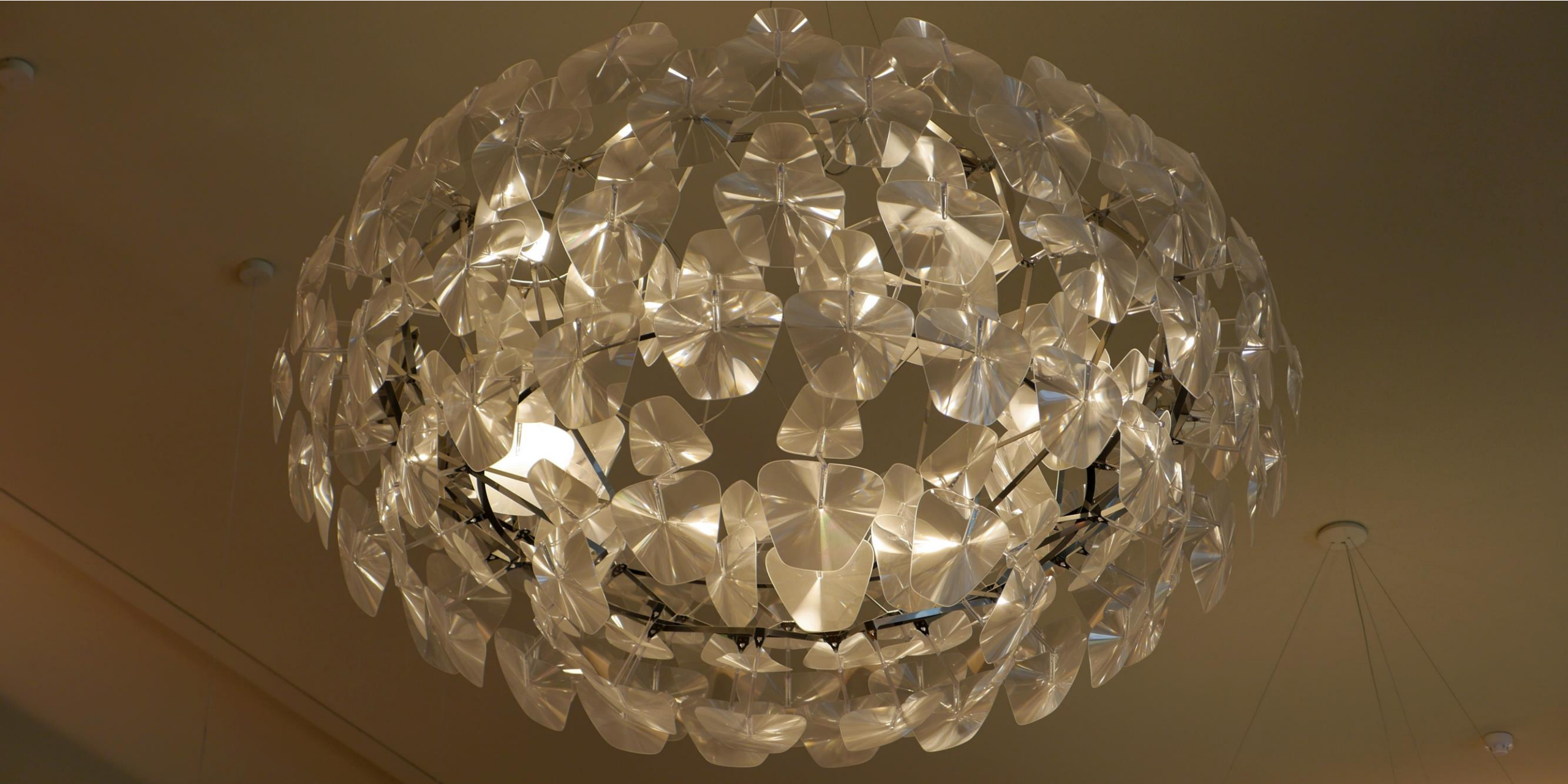
Een 'kroonluchter' in de ontvangsthal. Passend bij de allure van het museum.