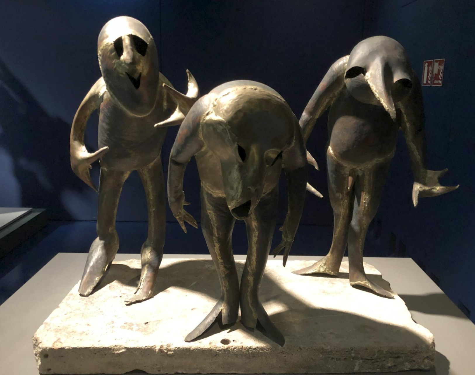
Reinhold – 'Curtain Call'. 1970.