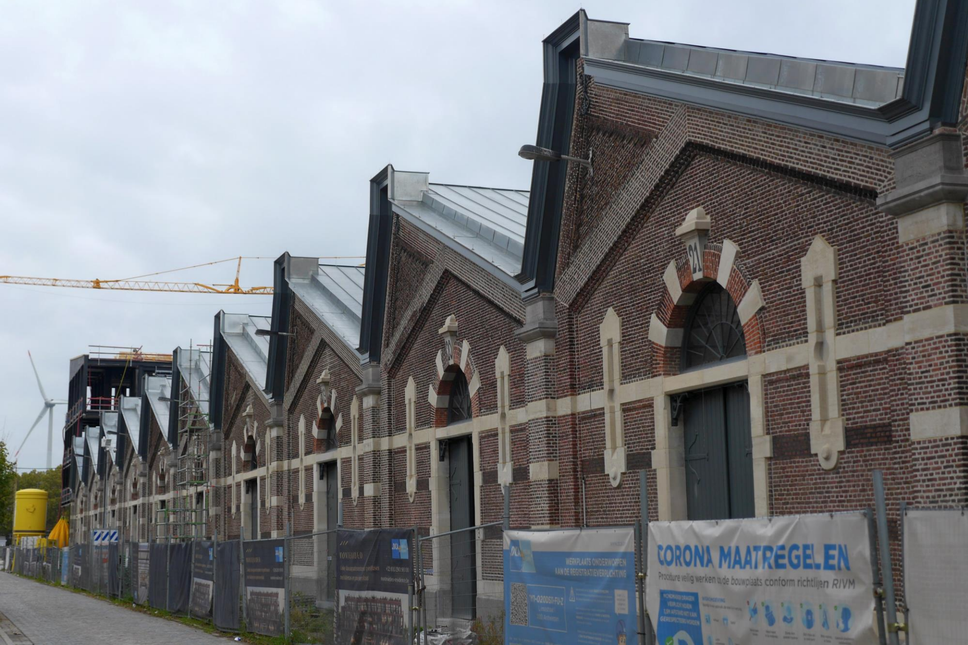
Montevideo: van pakhuis naar appartementen. Wikipedia: 'Dit pakhuisen werd gebouwd in 1895 en vernoemd naar de hoofdstad van Uruguay.. Doorheen de jaren werden er specerijen en voedingsmiddelen opgeslagen. Die bleven langer houdbaar omdat de typische 'shed'-daken naar het noorden gericht waren.'