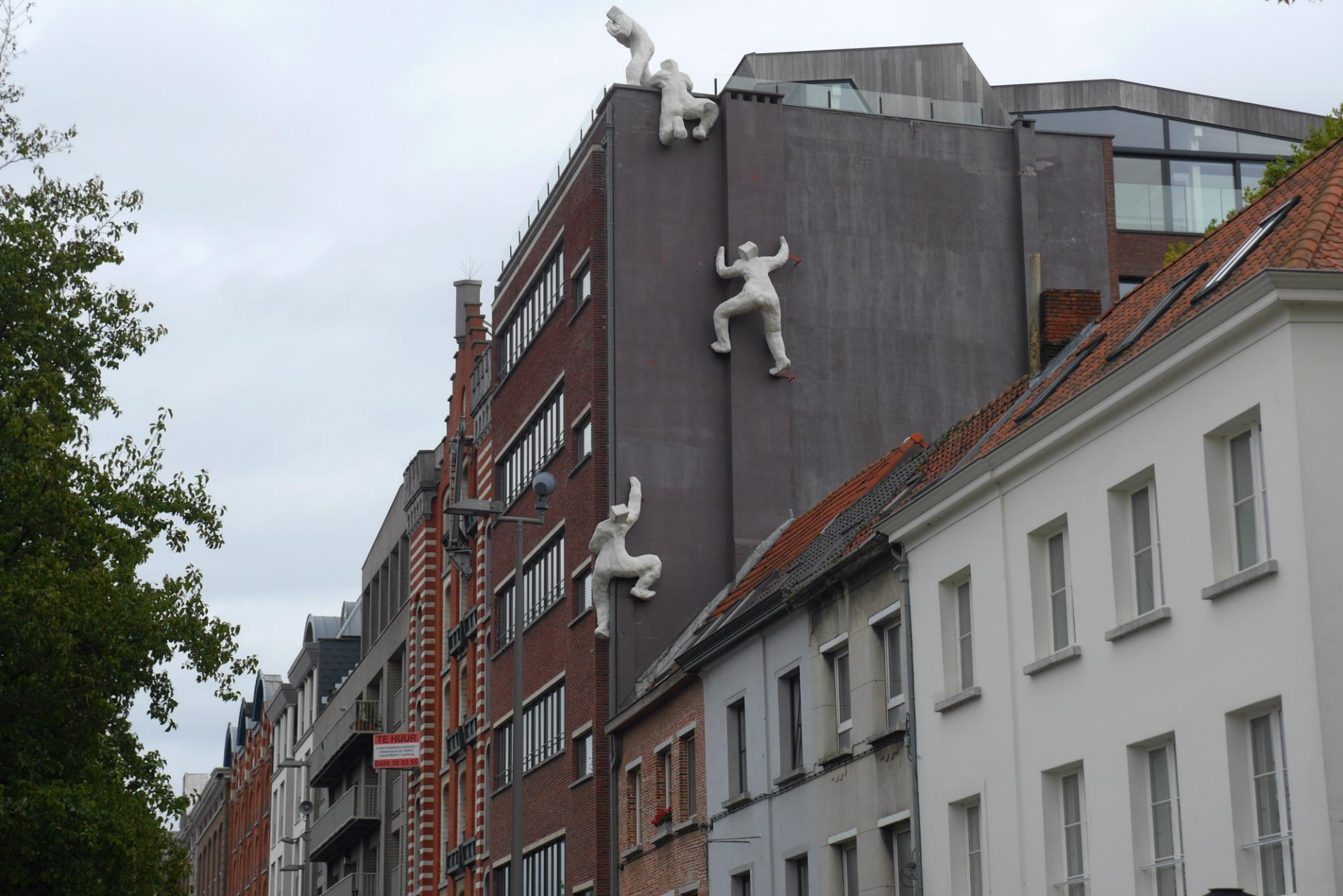
Tegenover het MAS