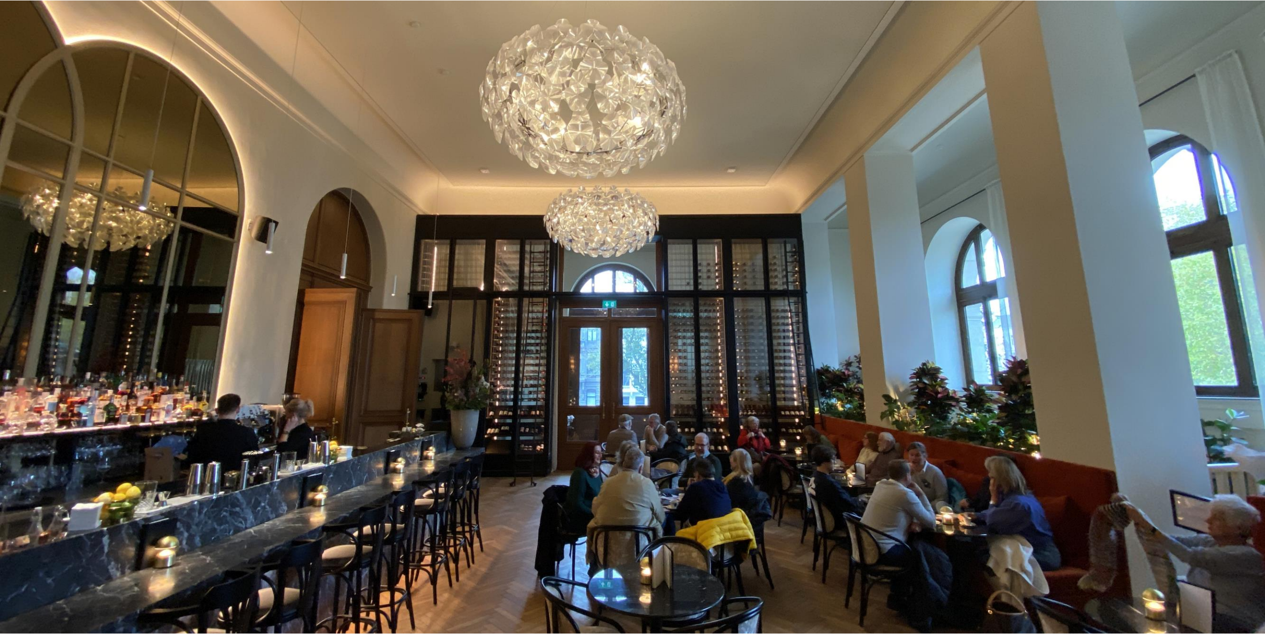
In het restaurant van het museum.