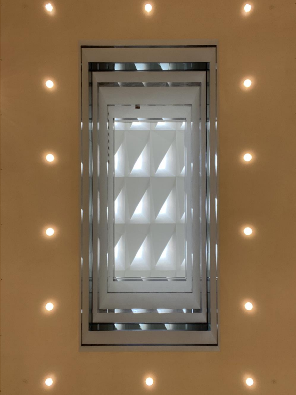
Het museum zelf is ook 'kunst'. Met prachtige doorkijken – III De camera ligt hier op de vloer en kijkt naar boven.