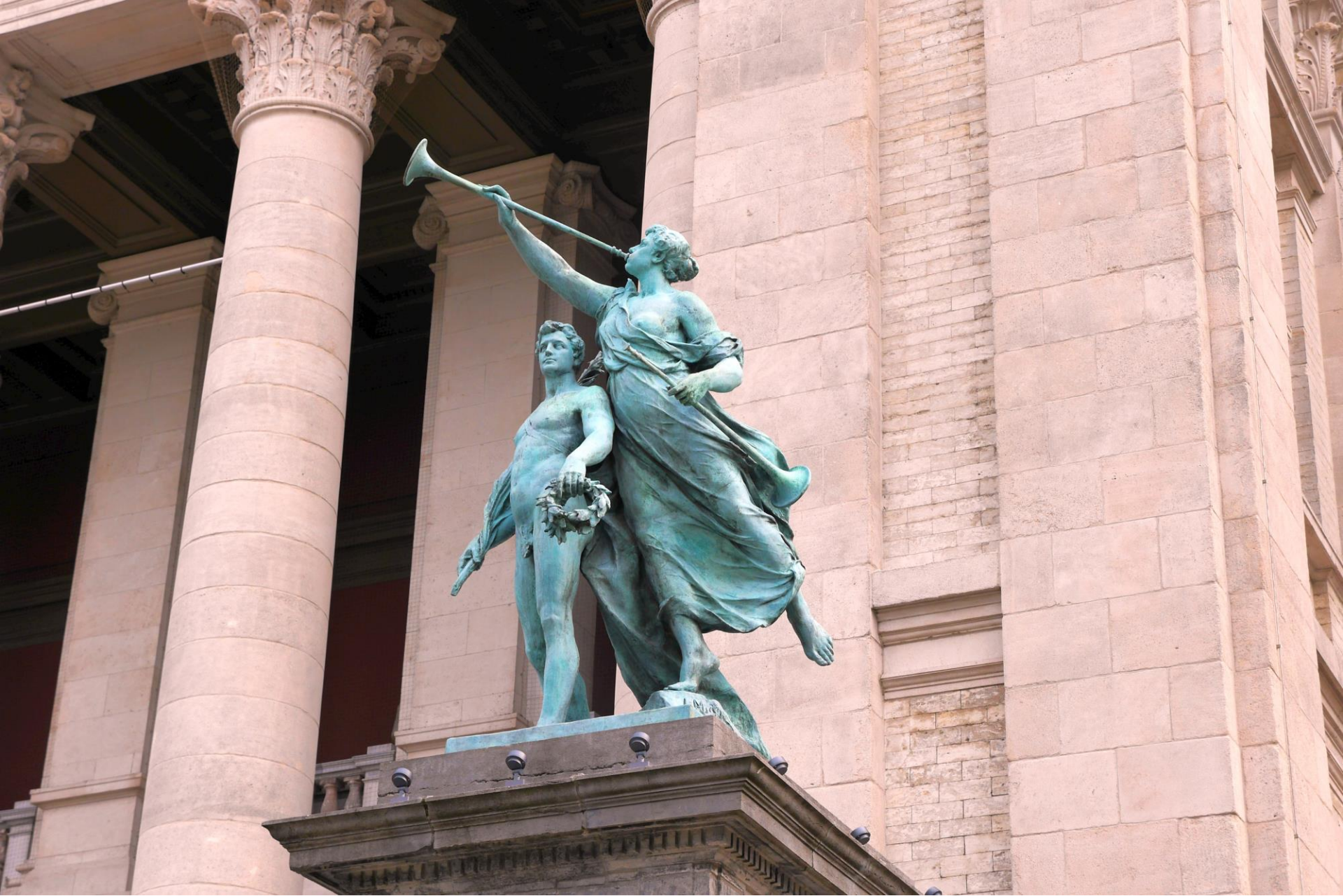
Kunst binnen... en kunst buiten.