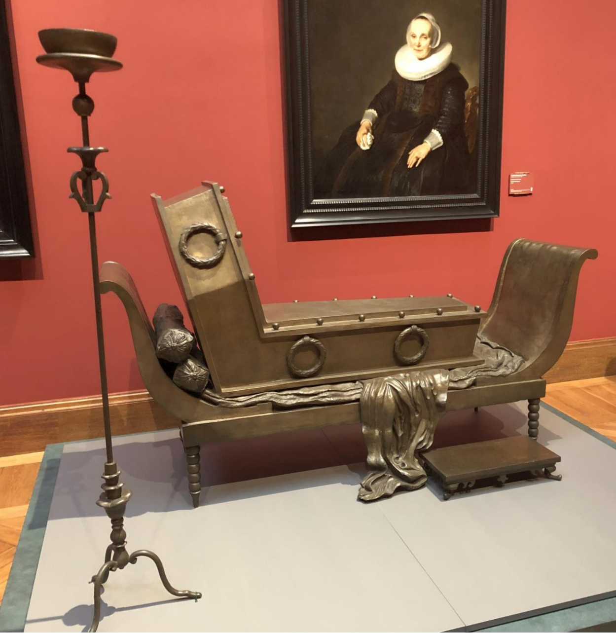
René Magritte - 'Madam Récamier'. 1967.