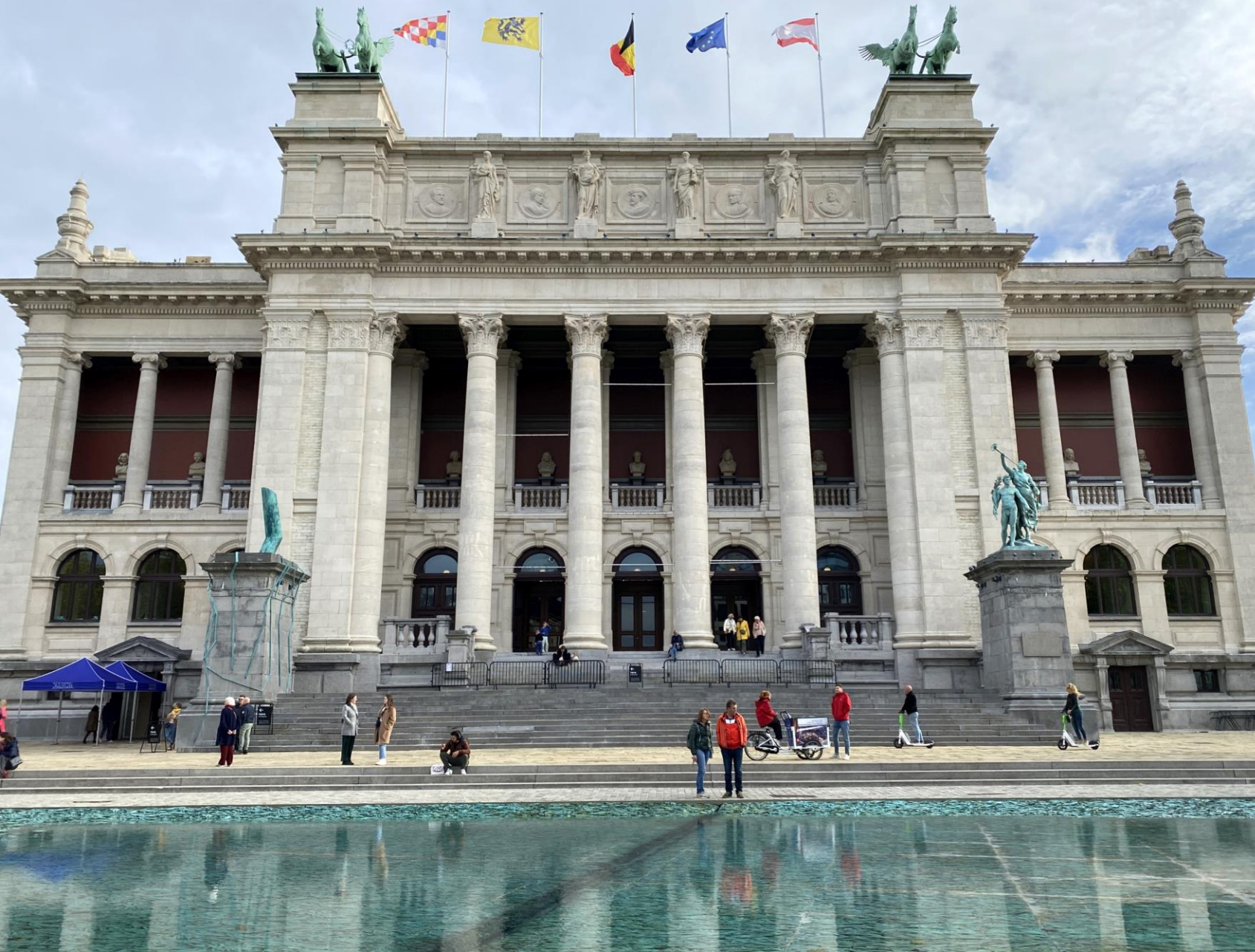
Nooit eerder gezien: 'eb en vloed' in deze 'vijver' met de naam 'De Waterspiegel'. Deze ligt voor het museum. Het ontwerp is van de Spaanse kunstenaar Cristina Iglesias.