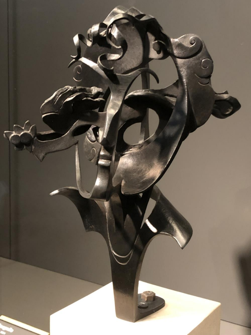
Paul Cargallo. 'Hulde aan Marc Chagall'. 1933.