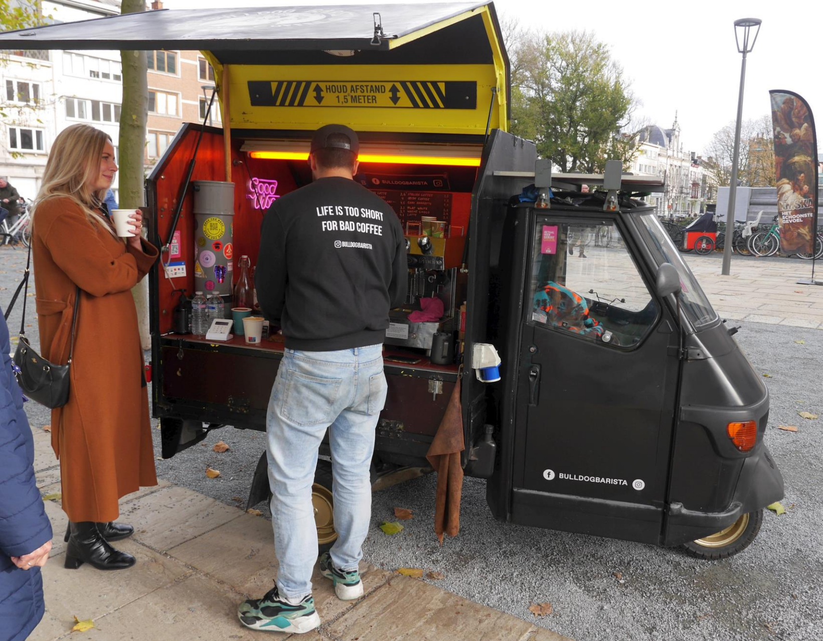
Op het voorterrein van het museum.