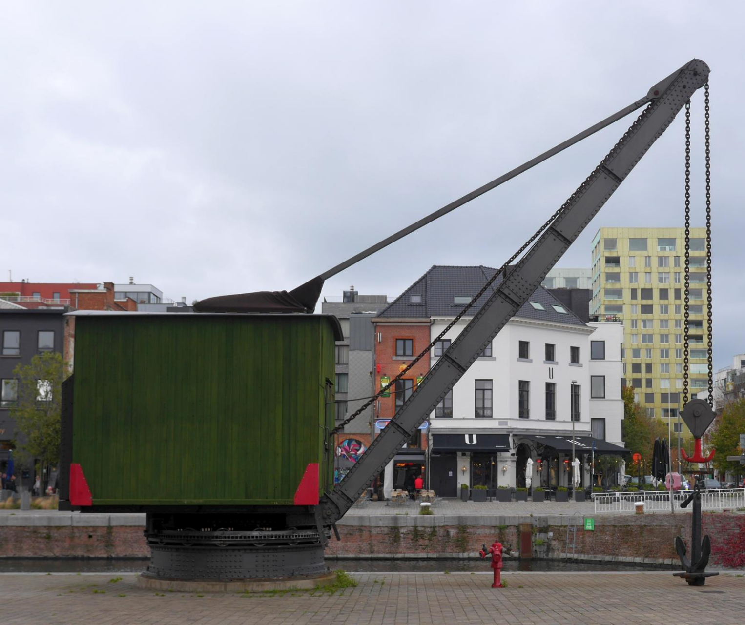
We zijn overduidelijk in het havengebied: op 'het Eilandje'.