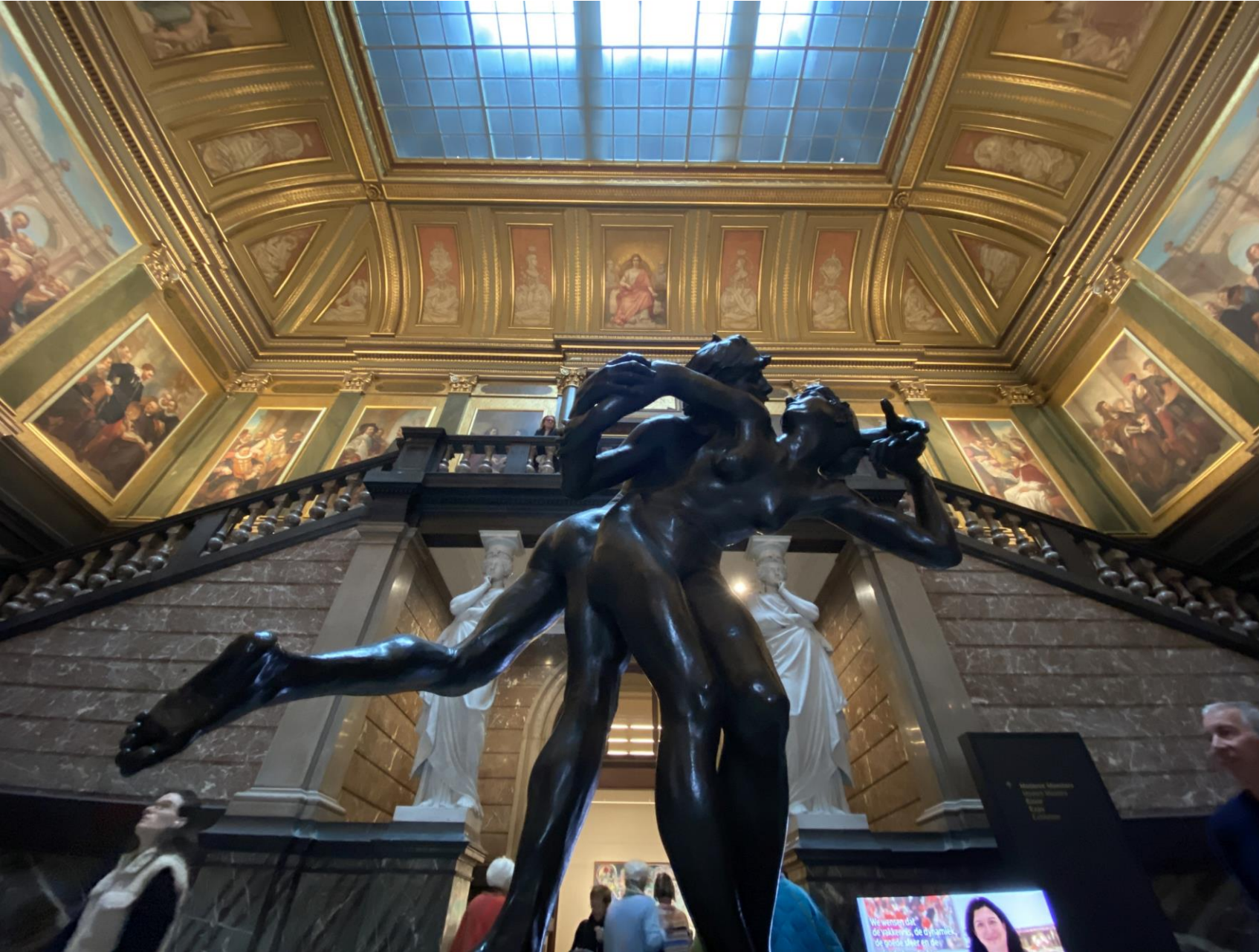
Entree en trappenhuis. II