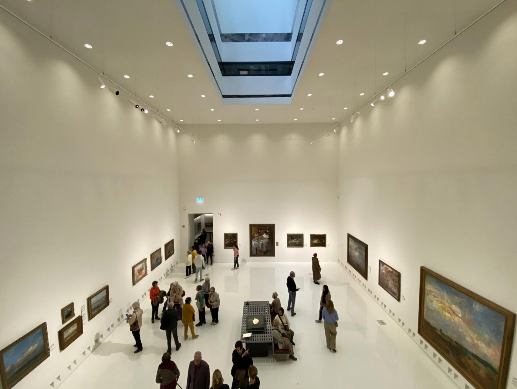
In een van de zalen. Hoog, groot, licht.