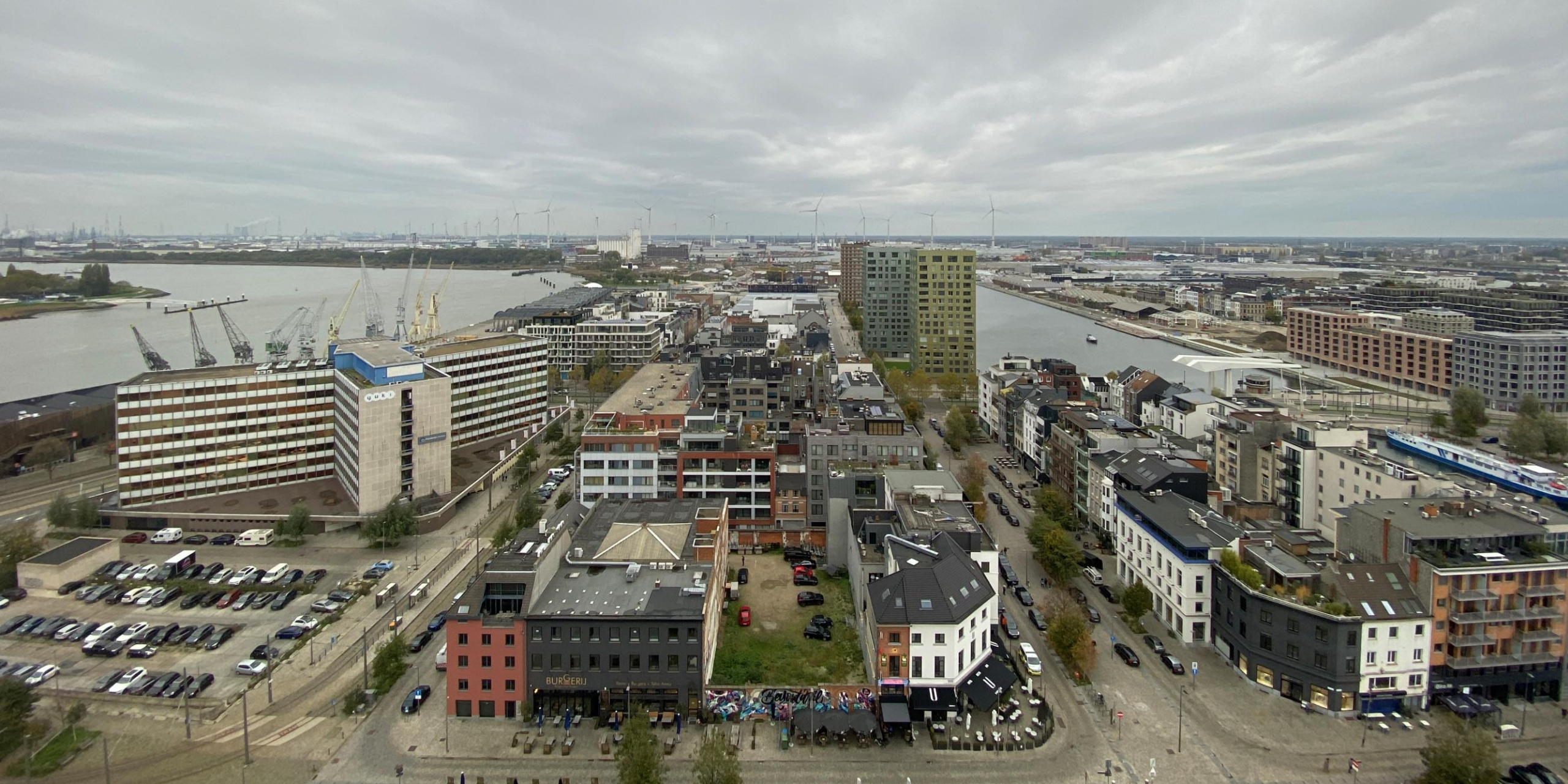
Op het panoramadak. 'Un toit avec vue'.