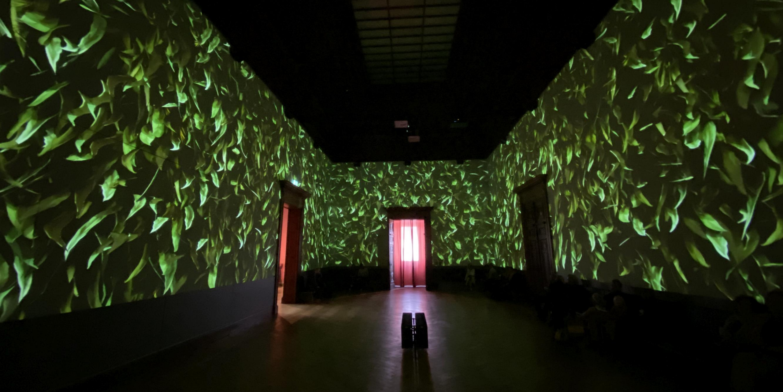
Videokunst. Indrukwekkend groot en kleurrijk.