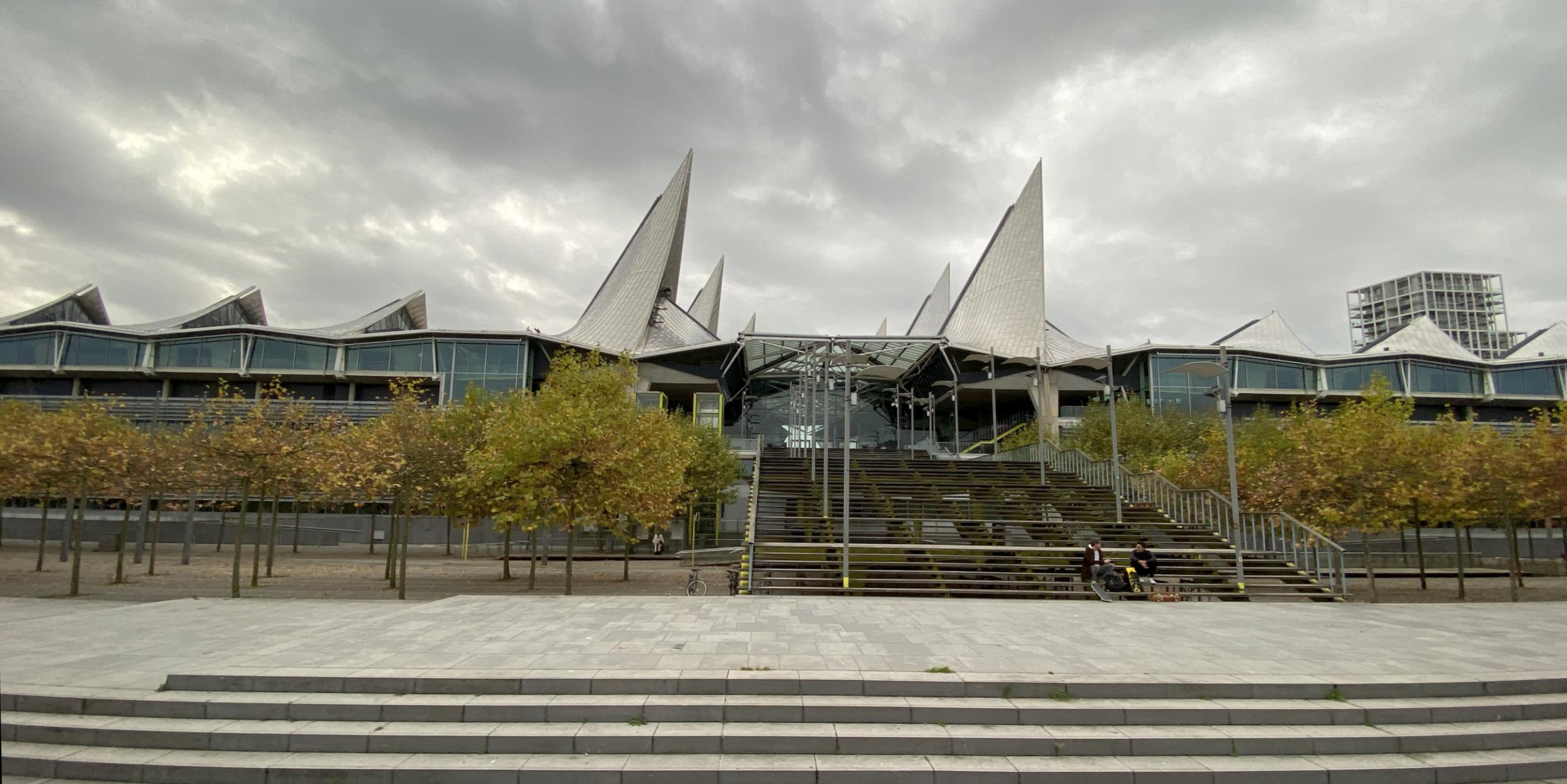
Dit is het Gerechtsgebouw van Antwerpen in het zuiden van de stad aan de Bolivarplaats. Ontworpen door architect Richard Rogers. Het heeft de bijnaam 'het Vlinderpaleis'.