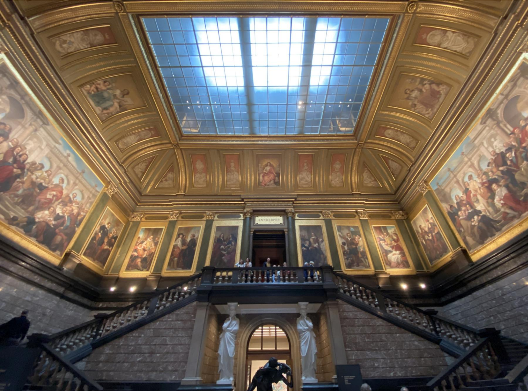
Entree en trappenhuis. I