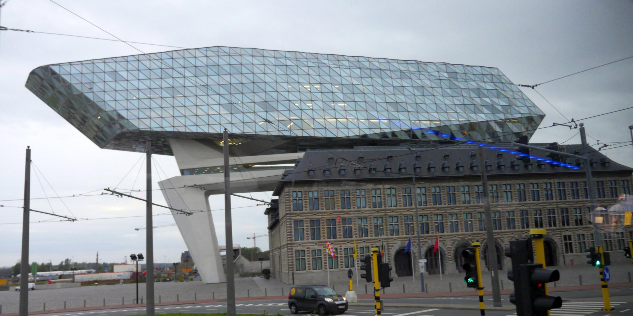
En als laatste een blik over de schouder op het Havenhuis, een werk van Zaha Hadid.