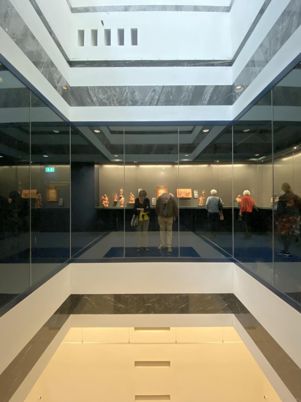
Het museum zelf is ook 'kunst'. Met prachtige doorkijken - I