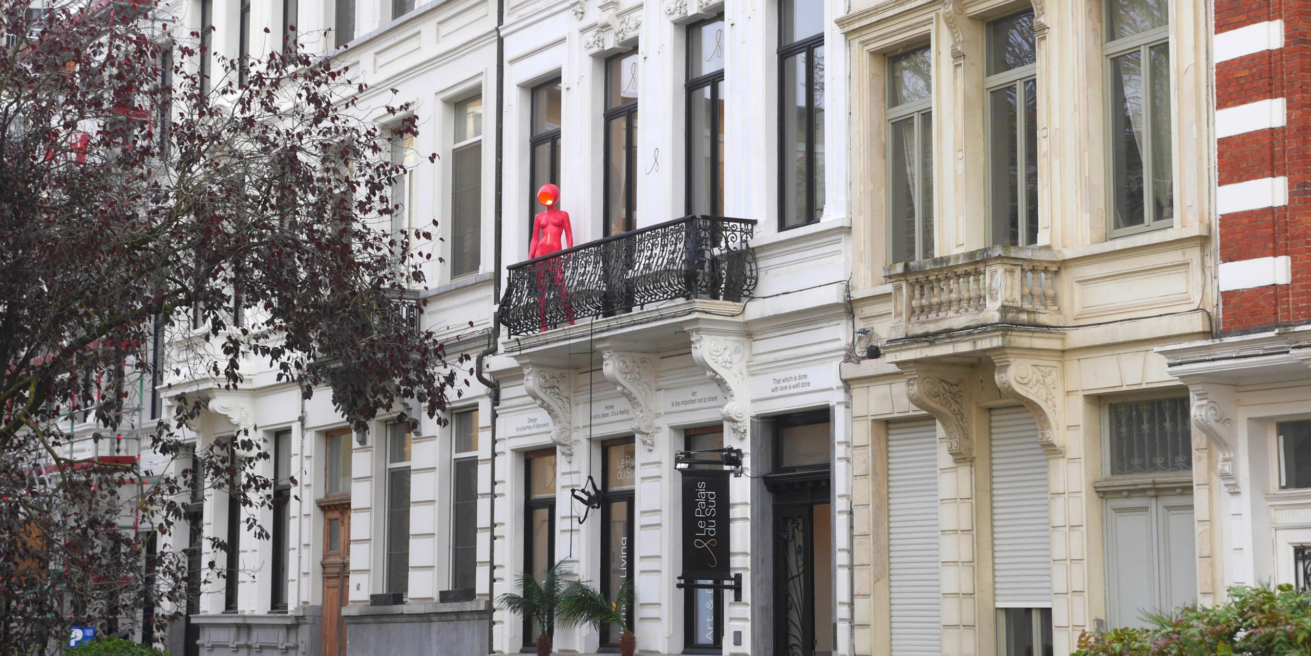
In de omgeving van het museum. Hoe zal ik dit noemen? Een buitenschemerlamp? 😊