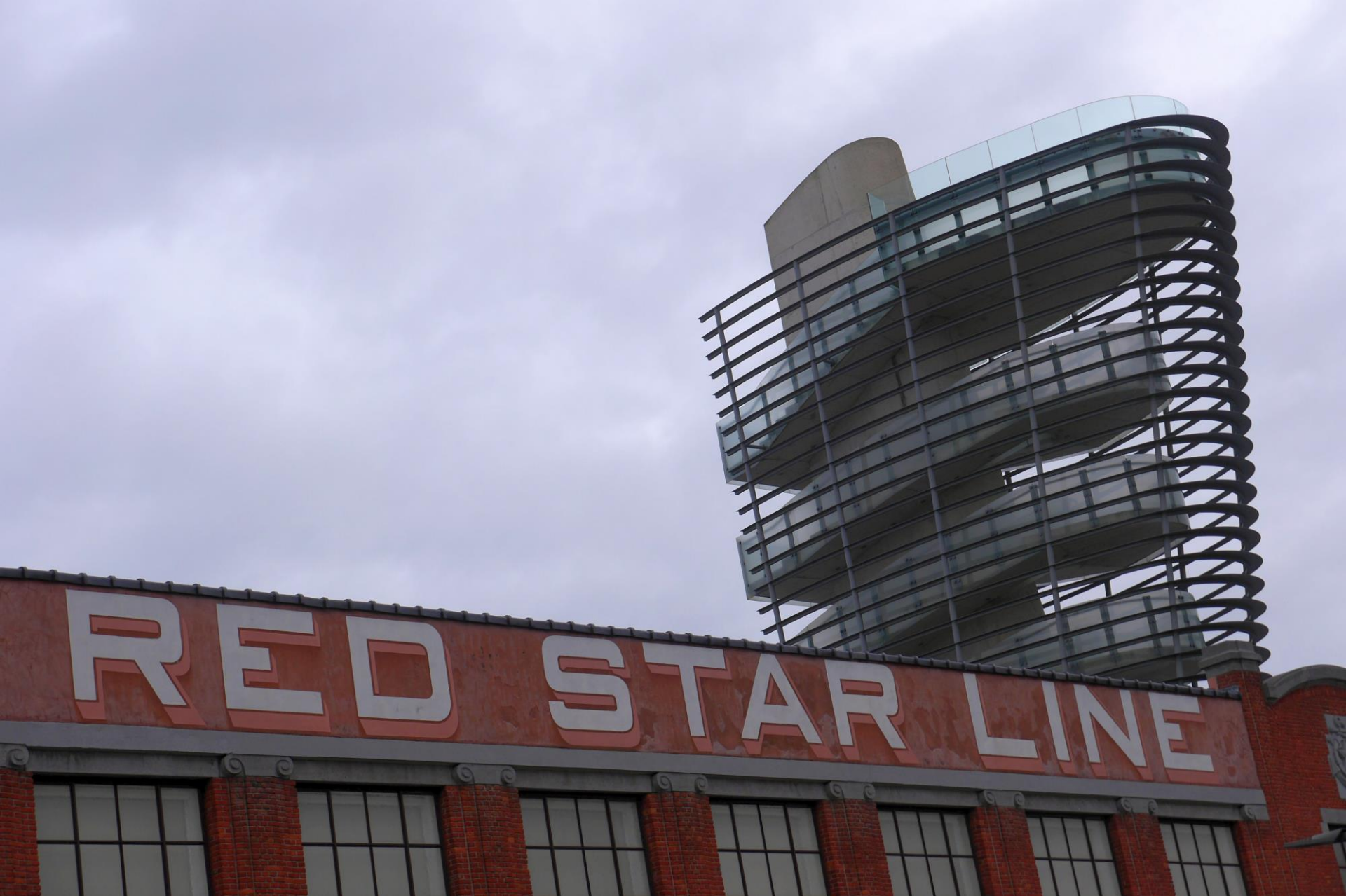
Museum mét uitzichtpunt. Wikipedia: 'Het Red Star Line Museum vertelt op de authentieke plek van de historische rederij op het Antwerpse Eilandje, aan de hand van persoonlijke verhalen van landverhuizers in de 20ste eeuw.'