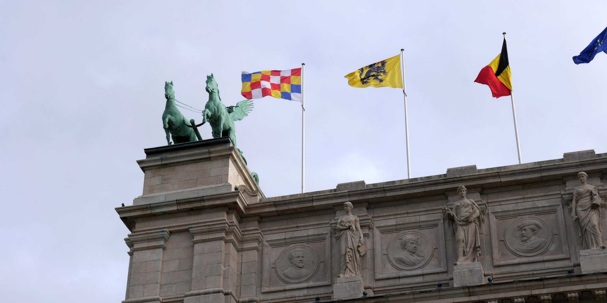
Eigenlijk zou je een rondje rondom het museum moeten kunnen vliegen ☺