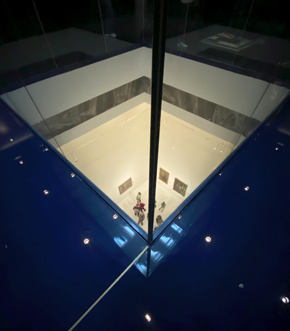
Het museum zelf is ook 'kunst'. Met prachtige doorkijken - II