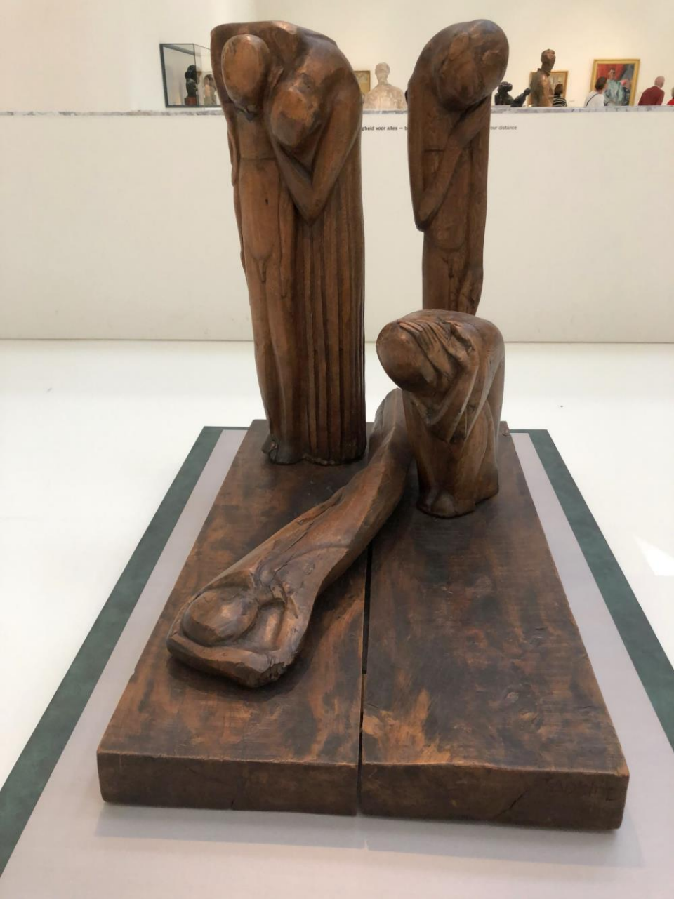
Zadkine – 'De ellende van Job'. 1914.